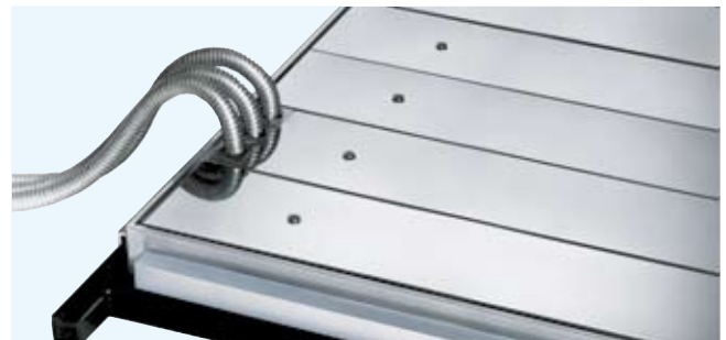
Bild 6: Bausatzfläche BSH, eingelegt in einen Profilstahlrahmen